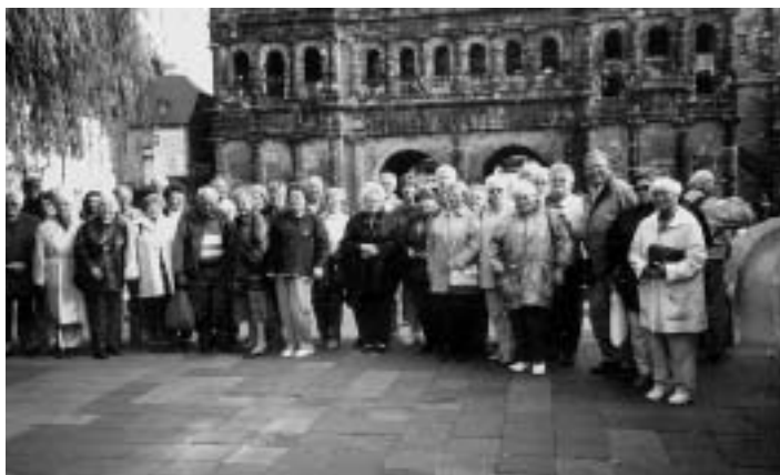
Von der Porta Nigra in Trier

Das malerische Dörfchen Meerfeld, am größten Maar der Westeifel, in einem der schönsten Urlaub- und Wandergebiete Deutschlands gelegen, war Ziel der AWO-Reisegruppe. Dieser,